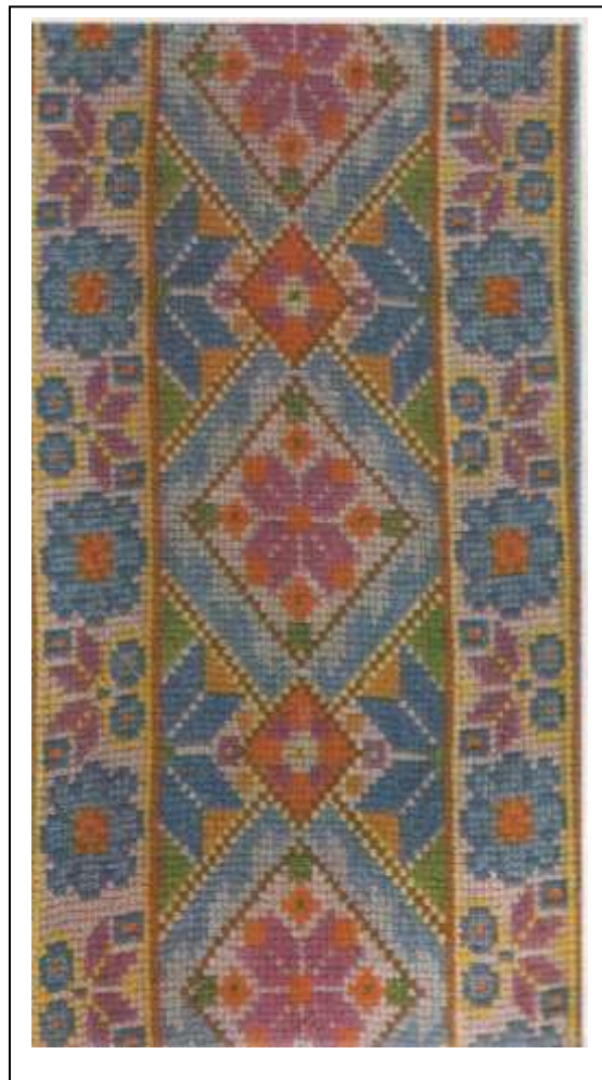
Л. Чарняўская. Дыванок. 1963 – 1968.

Апошнія 8 гадоў жыцця была прыкавана хваробай да ложка, але не страціла цікавасці да ўсяго навакольнага, любіла людзей, шмат чытала.