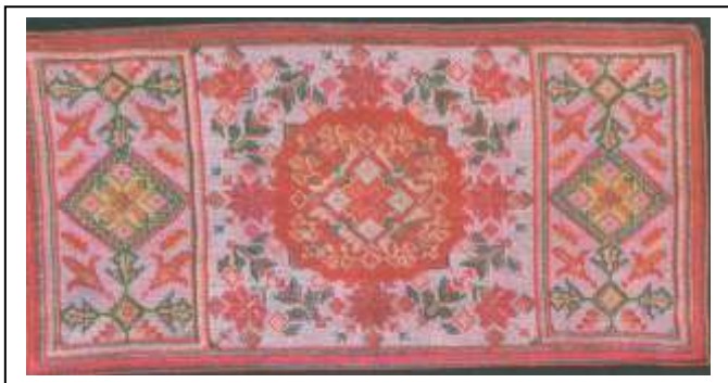
Л. Чарняўская. Вышываныя дарожкі. 1963 – 1968.